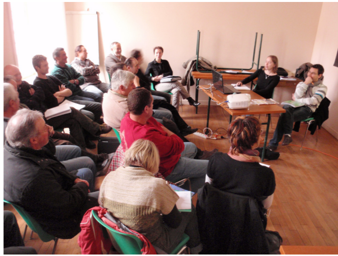
Groupe de travail à Chaudes-Aigues.

Lors de prochains groupes de travail, des propositions