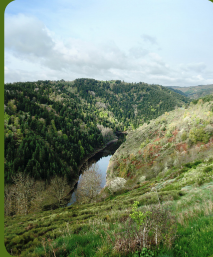
Forêt de pente