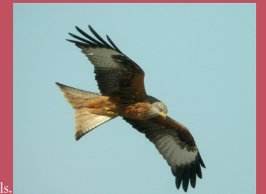
Milan royal