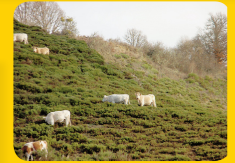
Pâturage tardif dans les landes