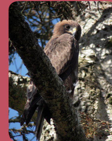
Aigle botté ©Romain Riols.

Exemple d'action : bilan annuel des actions