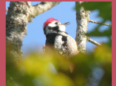
Pic mar ©Romain Riols.